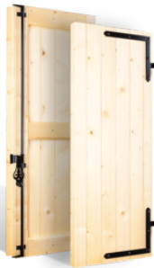
VOLETS BATTANTS 59mm DAUPHINOIS EN BOIS