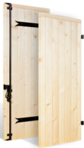
VOLETS BATTANTS 32mm GARDOIS EN BOIS