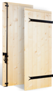
VOLETS BATTANTS 32mm À CLÉS EN BOIS